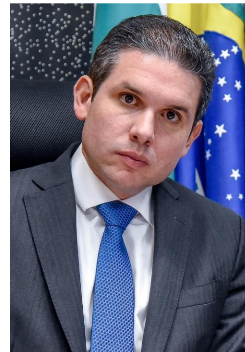
Deputado Hugo Motta – Presidente da Câmara dos Deputados

A mudança de postura da presidência da Câmara não ocorre em um vácuo político . A descentralização do poder e o fortalecimento das instâncias colegiadas podem ser interpretados como uma tentativa de Motta de consolidar sua liderança, garantir uma base política ampla além de construir maior previsibilidade nas votações.