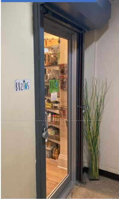
Entrada do Mercado

Abaixo, fotos do mercado e alguns dos produtos: