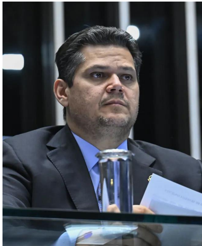
Senador Davi Alcolumbre (União/AP), Presidente do Senado.

Por fim, o descompasso do Governo Federal junto ao Senado também perpassa a relação com o presidente da Casa, Sen. Davi Alcolumbre (União/AP), caso que envolve diferentes temáticas ao longo dos últimos anos. Durante essa semana, ministros do Governo Federal se reuniram com Alcolumbre, que prometeu a estruturação de um cronograma para a votação da matéria, entretanto, ainda na terça-feira, o Presidente do Senado, em discurso no Plenário, reclamou da pressão que vem sofrendo para votar determinadas matérias que possuem caráter eleitoreiro.