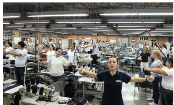
Aula de ginástica laboral promovida pelo Sesi na indústria de confecção Latreille

O trabalhador da indústria também tem acesso ao Cartão Sesi, ferramenta de gestão de benefícios sociais que subsidia serviços odontológicos, compras em farmácias, supermercados, livrarias e papelarias, além de desconto em cinema e teatro. São oferecidas também ações de cultura, esporte e lazer aos industriários e suas famílias.