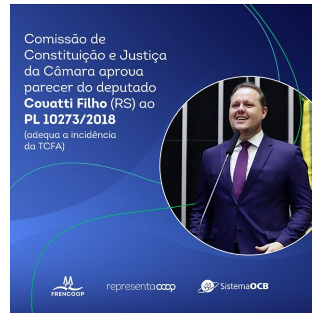
Imagem: OCB parabeniza relator da proposta:

Destaque ao relator do projeto, deputado Covatti Filho (PP-RS), pela liderança nas negociações, e aos deputados Pedro Lupion (PP-PR) e Sérgio Souza (MDB-PR) pela defesa do cooperativismo durante a votação da proposta.