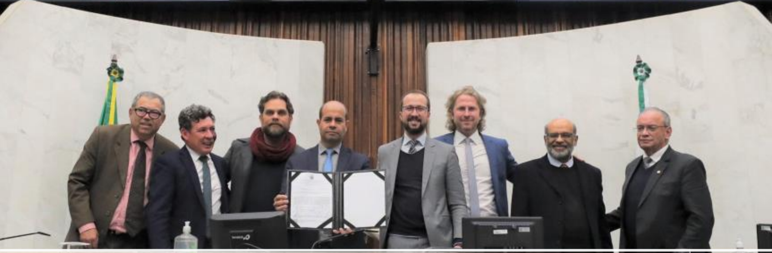
Frente Parlamentar da Reforma Tributária é lançada na Assembleia Legislativa do Paraná