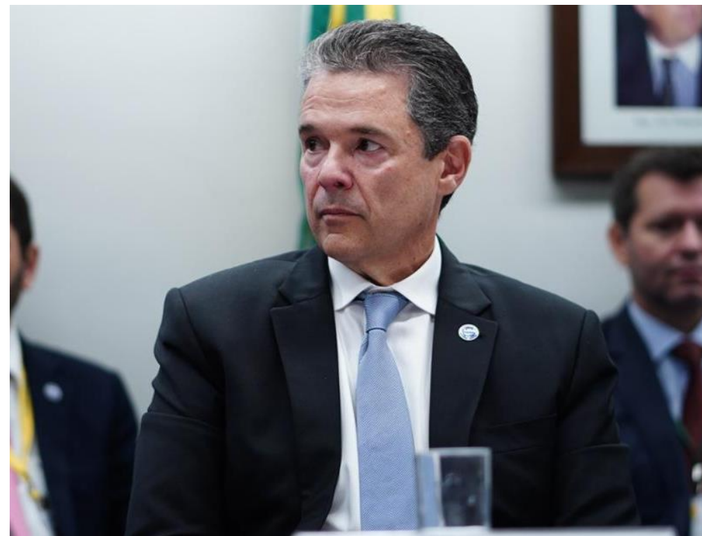
Imagem - Ministro da Pesca e Aquicultura André de Paula: